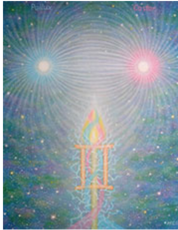
Pollux & Castor